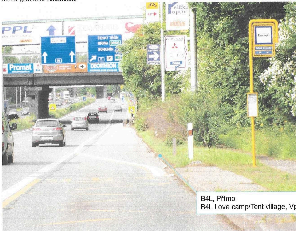
B4L, Přím B4L Love camp/Tent village, Vpravo

3) SILNICE I/56, PŘÍJEZD OD FRÝDKU-MÍSTKU, KŘÍŽOVATKA MÍSTECKÁ-RUDNÁ SMĚROVÁ TABULE PŘÍMO, SMĚROVÁ TABULE LOVE CAMP/TENT VILLAGE VPRAVO, společně dvě tabule těsně za zastávkou MHD „Kolonie Jeremenko“