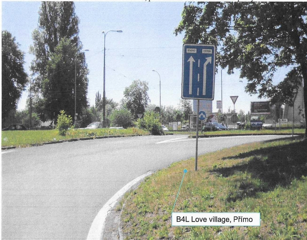
B4L Love village, Přímě