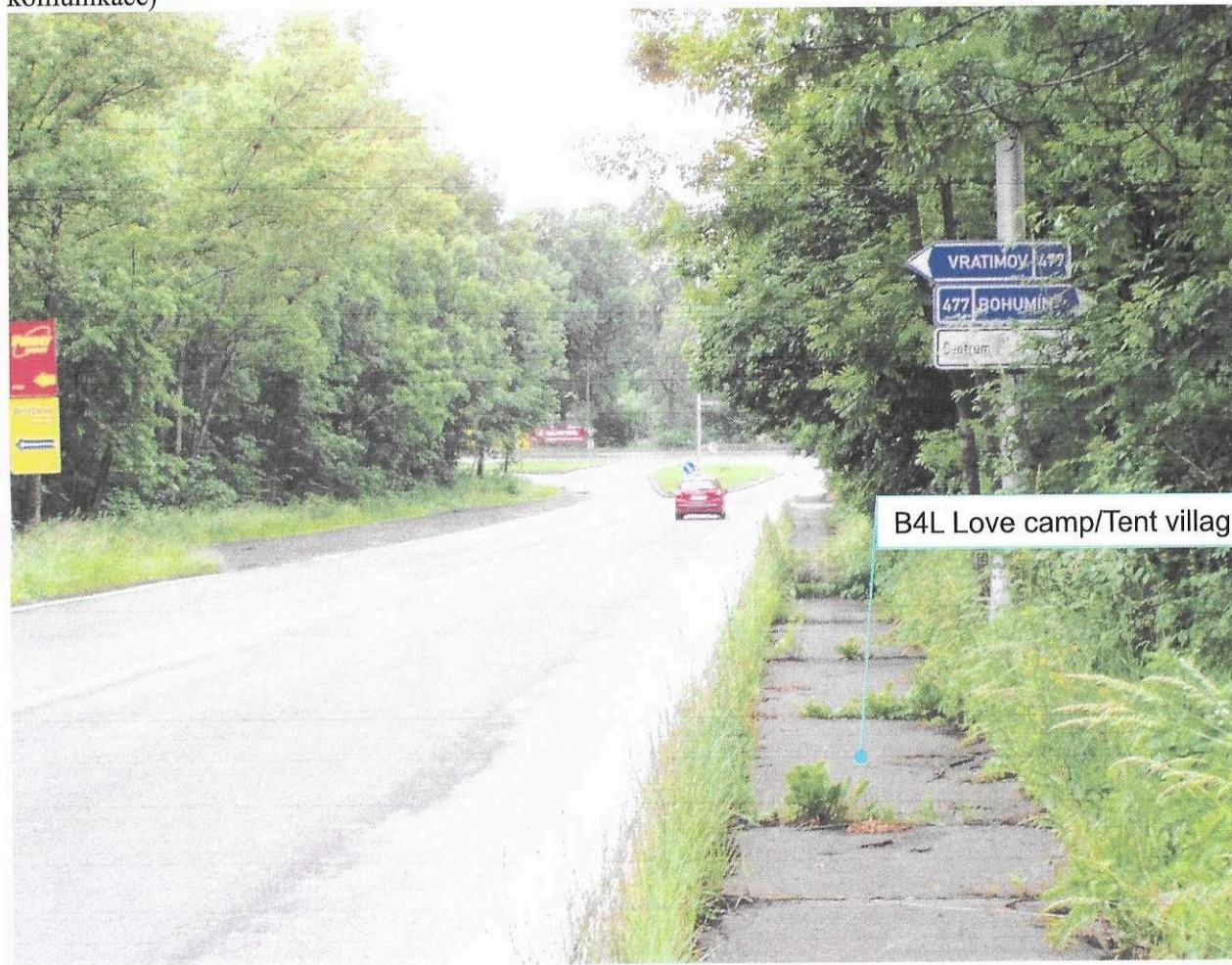
B4L Love camp/Tent village, Vpravo

24) SILNICE I/11, PŘÍJEZD OD PORUBY, KŘIŽOVATKA RUDNÁ-FRÝDECKÁ, JV RAMPA SMĚROVÁ TABULE LOVE CAMP/TENT VILLAGE VPRAVO, přibližně 20m před vyústěním ulice Antonína Kubity (na opačné straně komunikace)