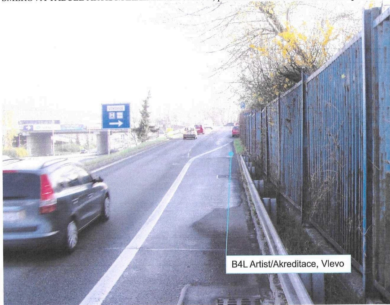
B4L Artist/Akreditace, Vlevo