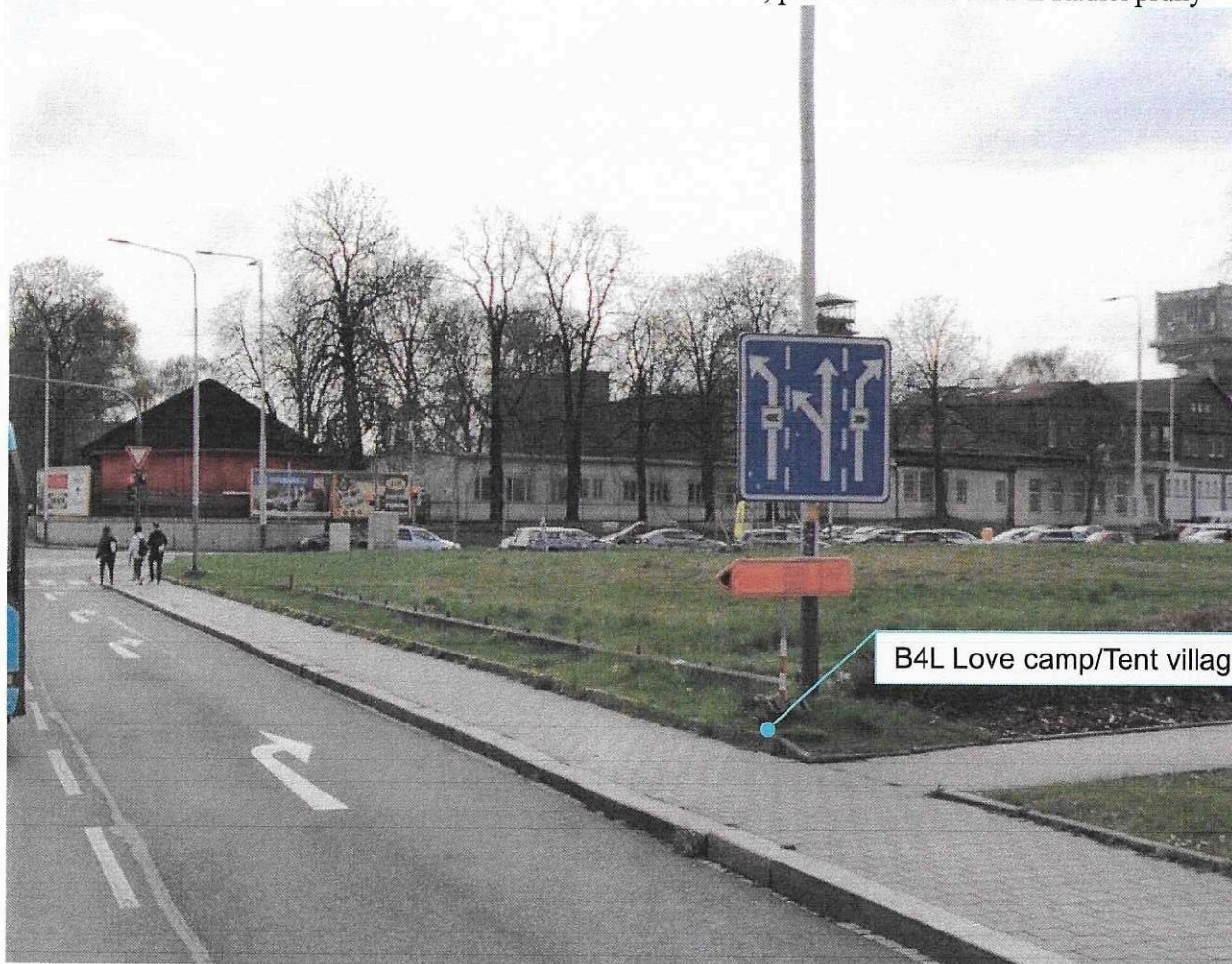
B4L Love camp/Tent village, Vlevo