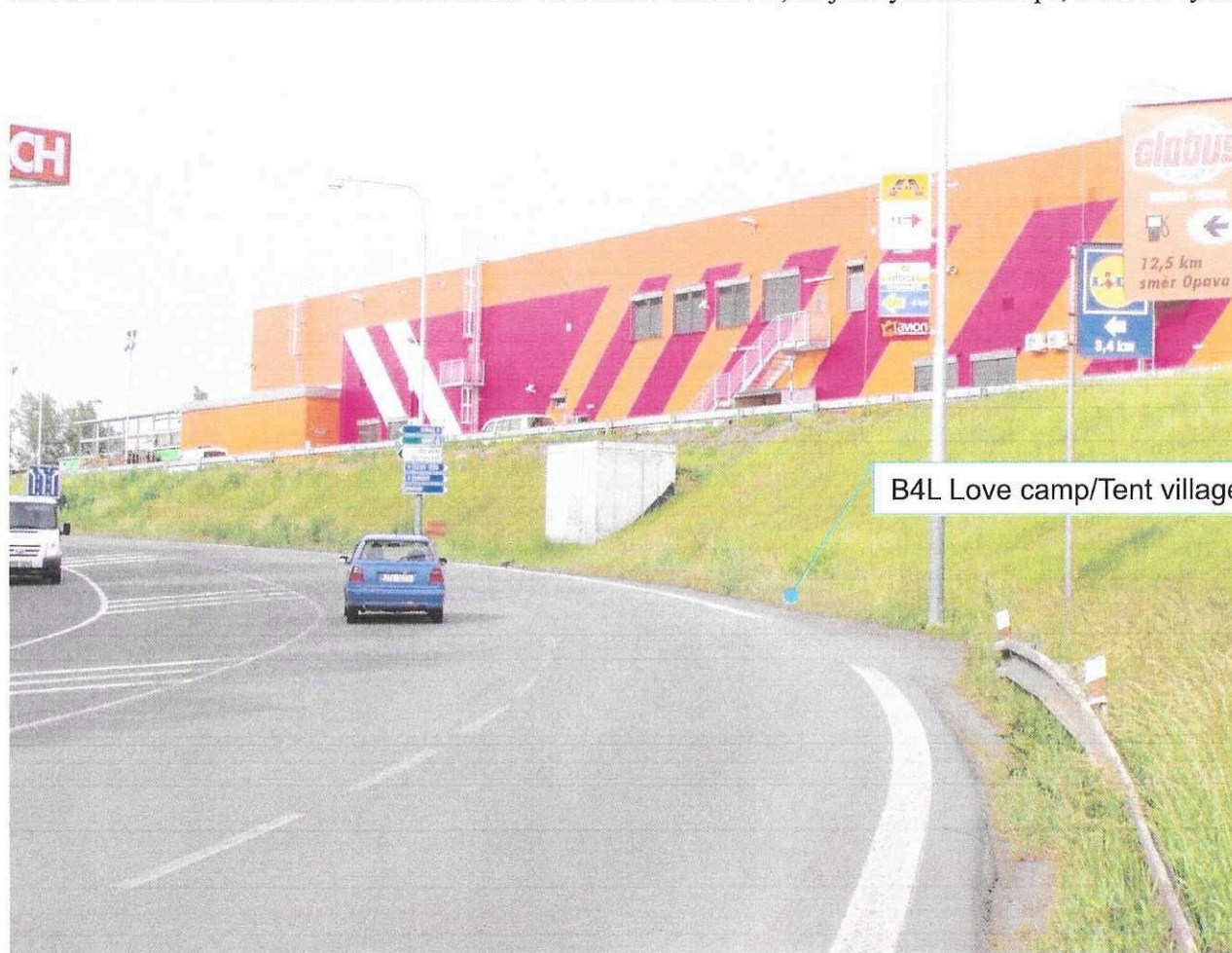
B4L Love camp/Tent village, Vpravo