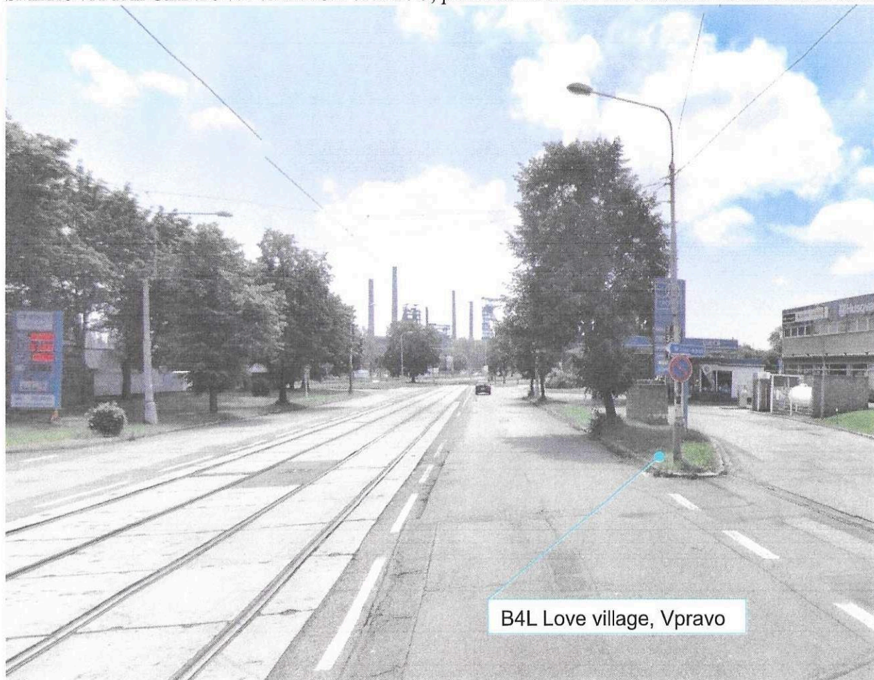
B4L Love village, Vpravo